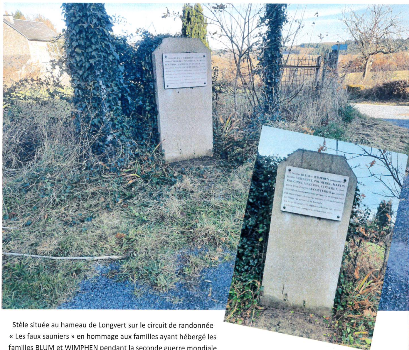
Stèle située au hameau de Longvert sur le circuit de randonnée « Les faux sauniers » en hommage aux familles ayant hébergé les familles BLUM et WIMPHEN pendant la seconde guerre mondiale